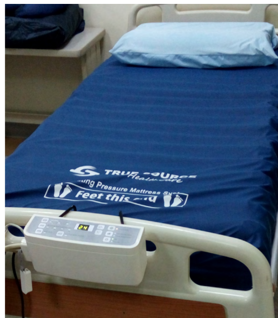
圖 1. 數位控制面板